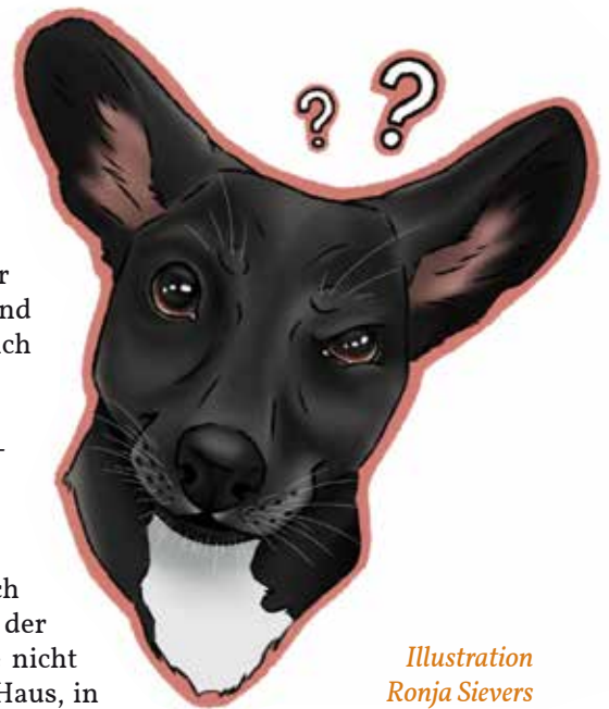
Illustration Ronja Sievers

Vielfältig sind die Rollen, die sie dabei spielen. Mitbewohner oder bester Freund bei jungen Singles, bei frisch Verheirateten gemeinsames, pflegebedürftiges Wesen vor dem ersten Baby. Kommen dann Kinder in die Familie, werden sie zu Spielkameraden für die Kleinen. Und werden die Nachkommen flügge, füllen sie deren Platz aus, nachdem sie ausgezogen sind. Nicht zu vergessen die Rolle als Helfer gegen die Einsamkeit im Alter.