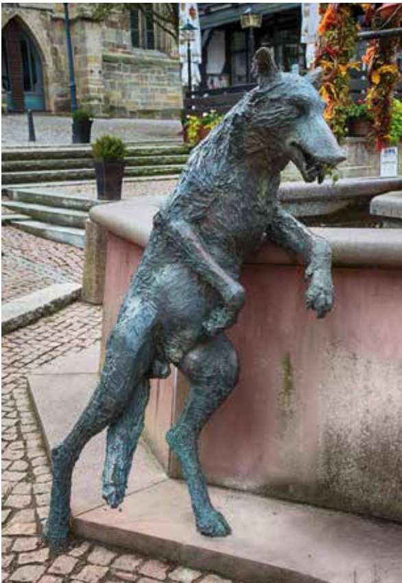
Deutsche Märchenstraße: Skulptur von Wolf und Geißlein auf dem Kirchplatz in Wolfhagen

Konflikte zwischen Mensch und Wolf drehen sich seit jeher um zwei Problemfelder: Der Gefährdung von Menschen und Weidetieren. Würde die Debatte um die Gefahr für Menschen ausschließlich faktenbasiert geführt, so wäre sie schnell beendet, denn an der Gefahrenlage hat sich seit der Rückkehr der Wölfe in ihr angestammtes Verbreitungsgebiet nichts geändert. Das Ergebnis der beiden NINA-Studien von 2002 und 2021, die Wolfsübergriffe zwischen 1950 und 2000 sowie zwischen 2002 und 2020 untersuchten, hat nach wie vor Gültigkeit: Wolfsangriffe auf Menschen sind in Europa trotz steigender Wolfspopulation extrem gering. Das Risiko, durch einen Zeckenbiss, einen Wespenstich oder bei einem Wildunfall zu sterben, ist ungleich größer als durch einen Wolf.