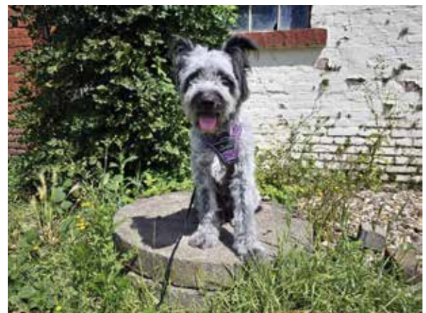
Mia, abgegebene Pudelmixhündin