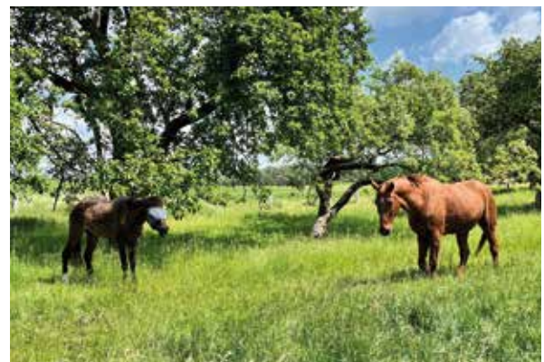
Fee mit Lichtschutzmaske, rechts Felix

Ein akuter Schub zeigt sich durch Schwellung, Tränen und Röte der Augen bzw. einem weißlichen Schimmer im Augeninneren, der auf den ersten Blick wie eine entstehende Blindheit wirkt. Doch die Tierärztin, die selbst bis abends auf den Hof kommt, wenn ein Pferd Hilfe braucht, hat Entwarnung gegeben und erklärt, dass es sich nicht um eine drohende Erblindung handelt, sondern um eine körpereigene Reaktion auf die Augenentzündung. Die Salbe, mit der die Entzündung behandelt wird, schlägt gut an – und überhaupt geht es Fee besser, wenn auf sonnengleißende, heiße Tage kühlere folgen. Denn das UV-Licht reizt ihre Augen, so dass sie häufig eine Lichtschutzmaske trägt.