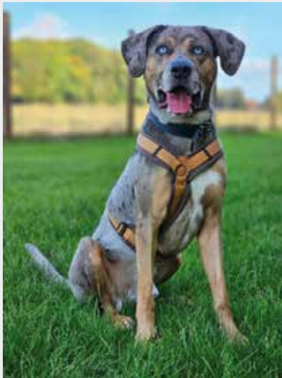
Madog Louisiana Catahoula Leopard Dog Am 7. April 2022 geboren Nicht kastriert Bedingte Verträglichkeit mit Artgenossen Nicht kinderlieb Seit September 2025 im Tierheim