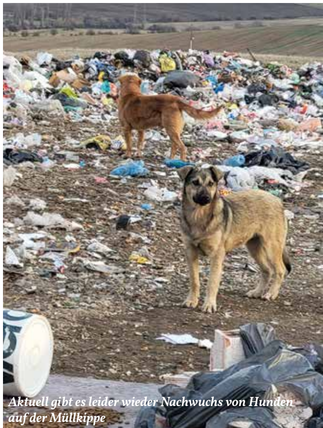
Aktuell gibt es leider wieder Nachwuchs von Hunden auf der Müllkippe

In einem gemeinsamen Schreiben von BVT und Freie Tierhilfe e.V. hatten wir den Bürgermeister von Kyustendil aufgefordert, die auf der Müllkippe lebenden Hunde kastrieren und impfen zu lassen. Gibt es Anzeichen, dass der Bürgermeister unserer Aufforderung gefolgt ist?