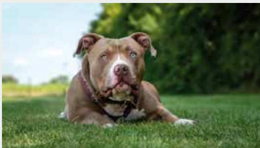
Tyson American Bully XXL 2023 geboren Kastriert Bedingte Verträglichkeit mit Artgenossen Vermittlung zu Familien mit älteren Kindern Seit Februar 2025 im Tierheim