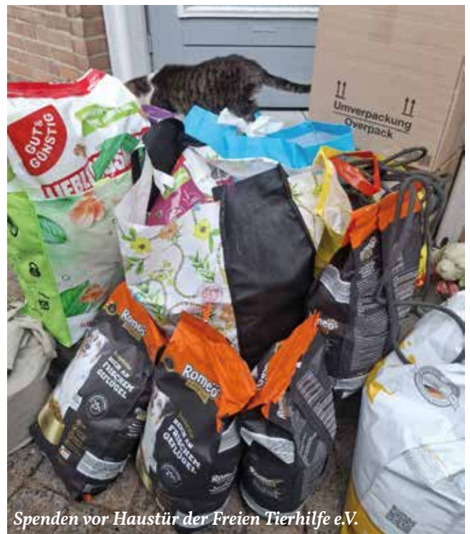
Spenden vor Haustür der Freien Tierhilfe e.V.

Gott sei Dank ist es uns gelungen, im Januar noch einmal fünf Paletten mit drei Tonnen Futter auf den Weg bringen zu können. Dabei kamen als Futterspenden vom Tierheim Wesel drei Paletten Tierfutter, für die wir dann „nur“ den Transport nach Sibiu bezahlt haben (der übrigens ein immer größerer Kostenfaktor wird). Und zwei Paletten wurden uns, der Freien Tierhilfe e.V., für seine Tierschutzarbeit gespendet (ebenfalls über das Tierheim Wesel). Unsere Futterlieferungen sind eine gewaltige Hilfe für unsere Partner – allerdings im Angesicht des übervollen Tierheims von derzeit ca. 160 Hunden und über 100 Katzen auch schnell wieder aufgebraucht.