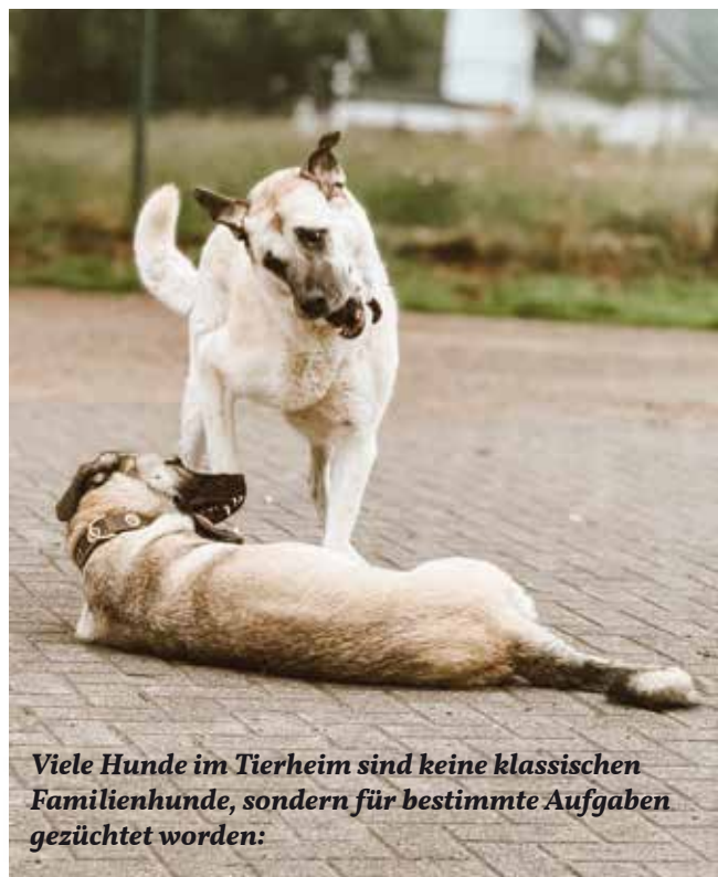
Viele Hunde im Tierheim sind keine klassischen Familienhunde, sondern für bestimmte Aufgaben gezüchtet worden:

Ein weiterer wichtiger Aspekt sind rassespezifische Anlagen.