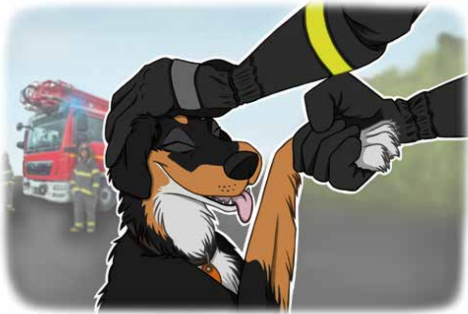
Illustration Ronja Sievers