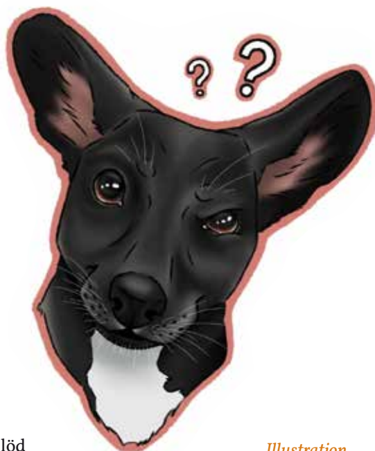
Illustration Ronja Sievers