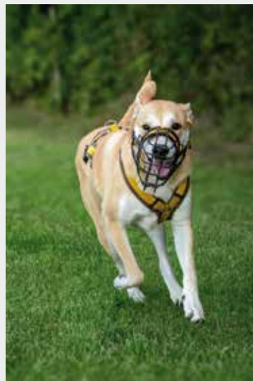
Debby Labrador-Akita-Mischling Im Juli 2023 geboren Kastriert Bedingte Verträglichkeit mit Artgenossen Nicht kinderlieb Seit Juli 2024 im Tierheim