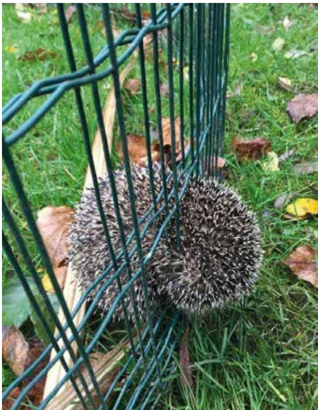
Igel in Doppelmattenzaun

Hinzu kommt, dass Freischneider gerade dort eingesetzt werden, wo Igel ihre Schlaf- und Nestplätze einrichten, nämlich unter Büschen, an Heckenrändern und in verwilderten, überwucherten Ecken. Wurden früher im Frühjahr und Sommer nur wenige hilfsbedürftige Igel eingeliefert, die beim Kompostumsetzen mit Mistforken verletzt oder von einem Hund gebissen wurden, verzeichnen die Tierhilfen immer mehr Igel mit typischen Verletzungsmustern.