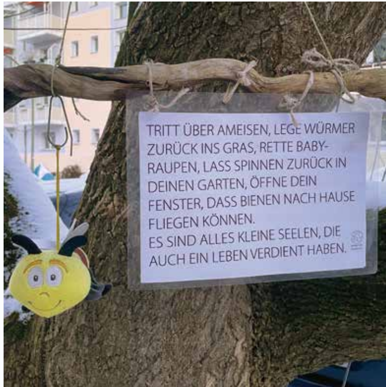
Gesehen an einem Fußweg in Potsdam